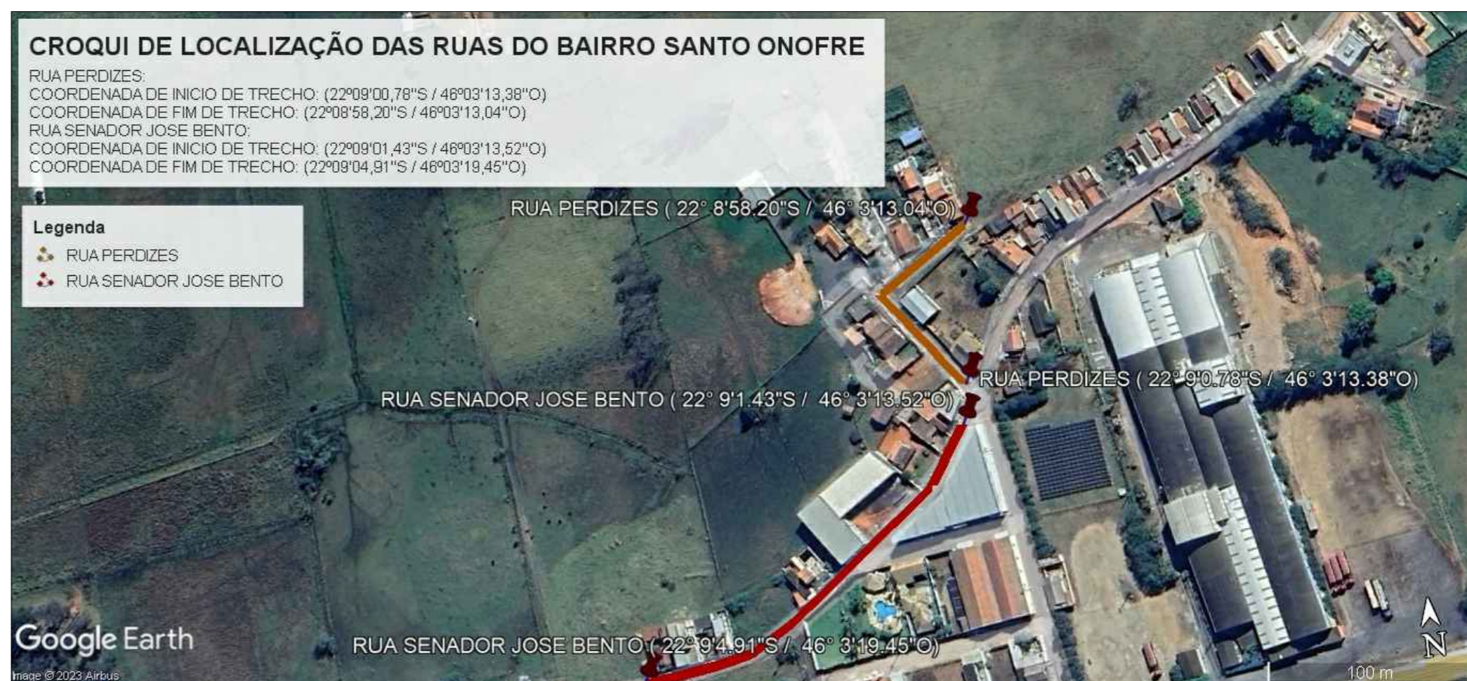
LOCALIZAÇÃO DAS RUAS NO BAIRRO SANTO ONOFRE RUA PERDIZES: COORDENADAS: INICIAL (22°9'0,78"S / 46°3'13,38"O) - FINAL (22°8'58,20"S / 46°3'13,04"O) RUA SENADOR JOSE BENTO: COORDENADAS: INICIAL (22°9'1,43"S / 46°3'13,52"O) - FINAL (22°9'4,91"S / 46°3'19,45"O)