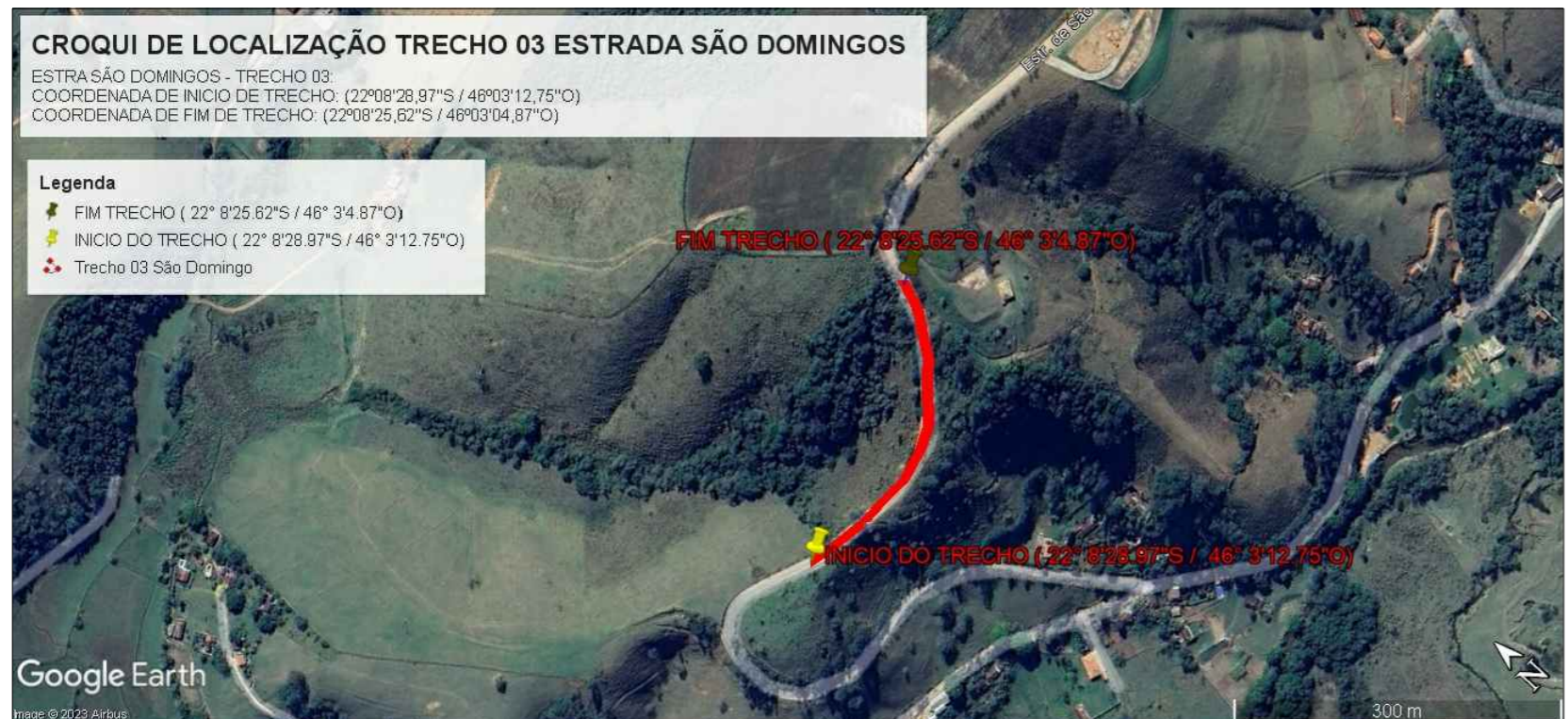
LOCALIZAÇÃO ESTRADA MUNICIPAL SÃO DOMINGOS - TRECHO 03 COORDENADAS: INICIAL (22°8'28,97"S / 46°3'12,75"O) - FINAL (22°8'25,62"S / 46°3'4,87"O)