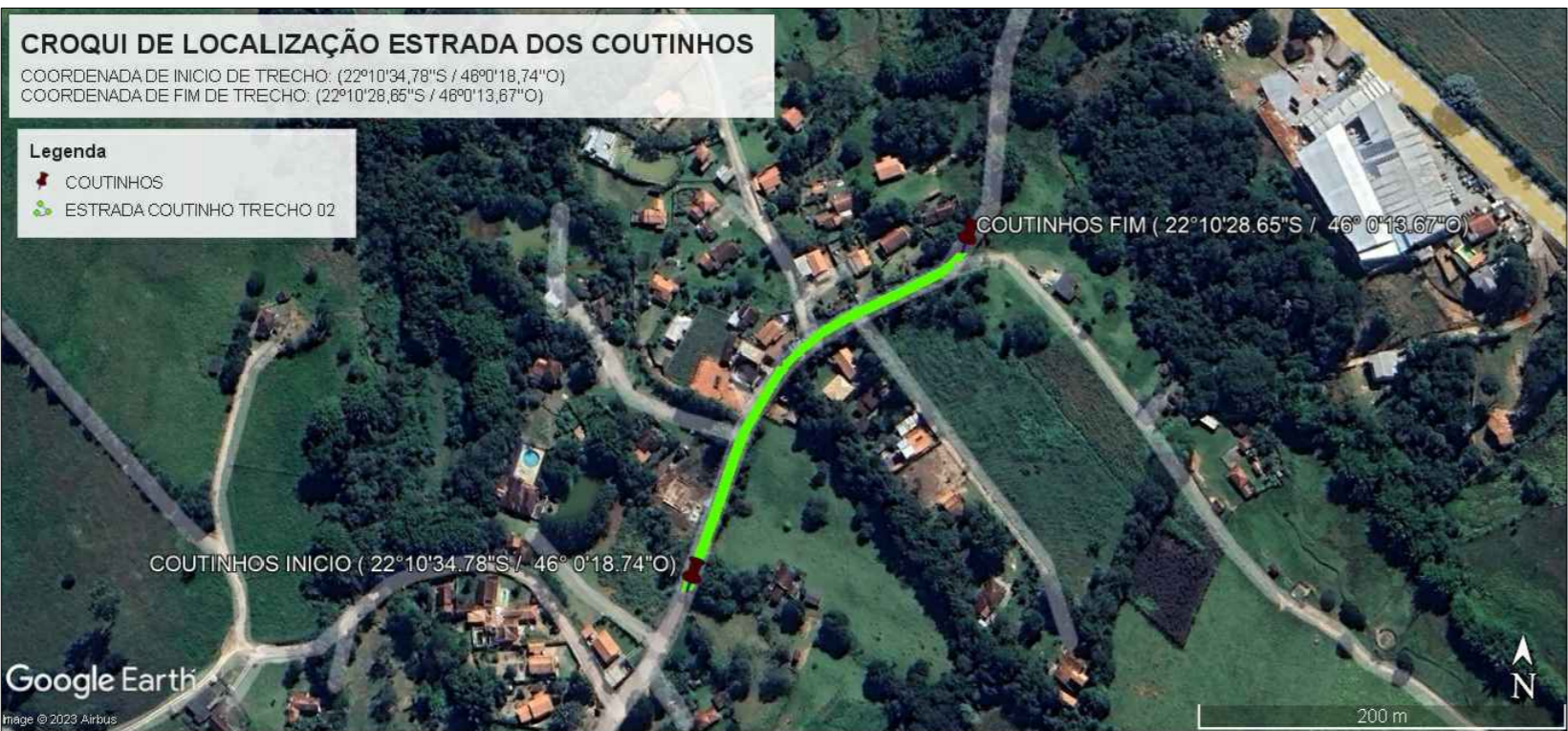
LOCALIZAÇÃO ESTRADA DOS COUTINHOS COORDENADAS: INICIAL (22°10'34,78"S / 46°0'18,74"O) - FINAL (22°10'28,65"S / 46°0'13,67"O)